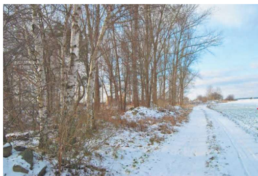
Teren na park rodzinny