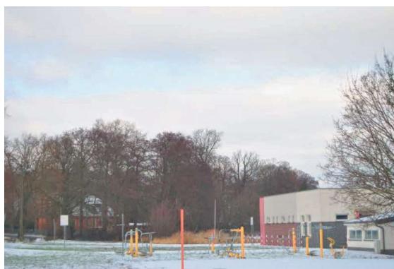
Siłownia zewnętrzna i boisko przy plaży