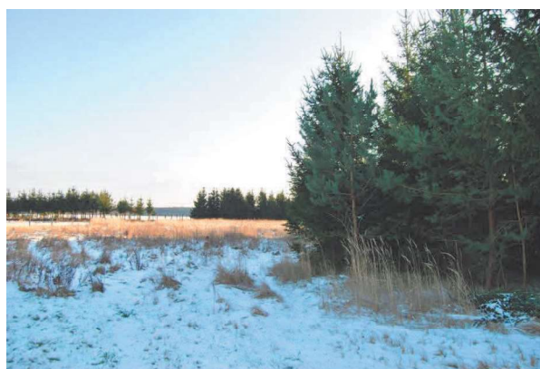
Teren pod zabudowę rekreacyjną