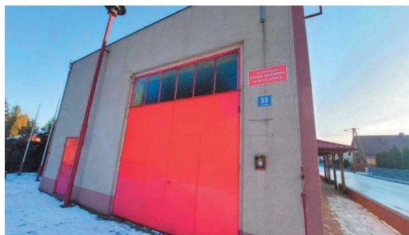
Remiza OSP w Przybyszewie