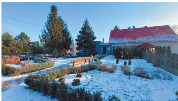
Skwer przed salką Stowarzyszenia ZMW