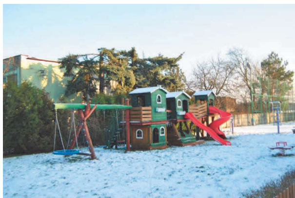
Plac zabaw w Przybyszewie