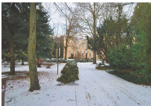
Zespół pałacowo - parkowy