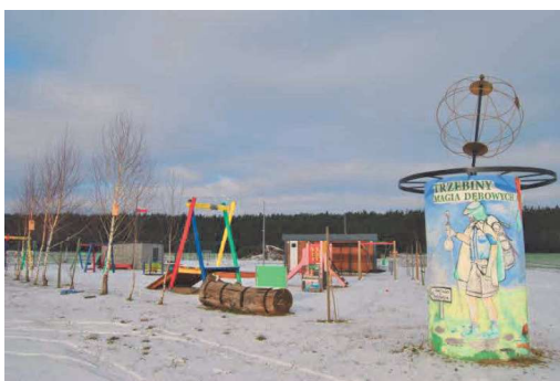
Plac zabaw i świetlica wiejska w tle