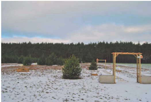
Ogród edukacji sensorycznej